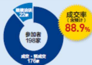
[根据高谈结果问卷调查]