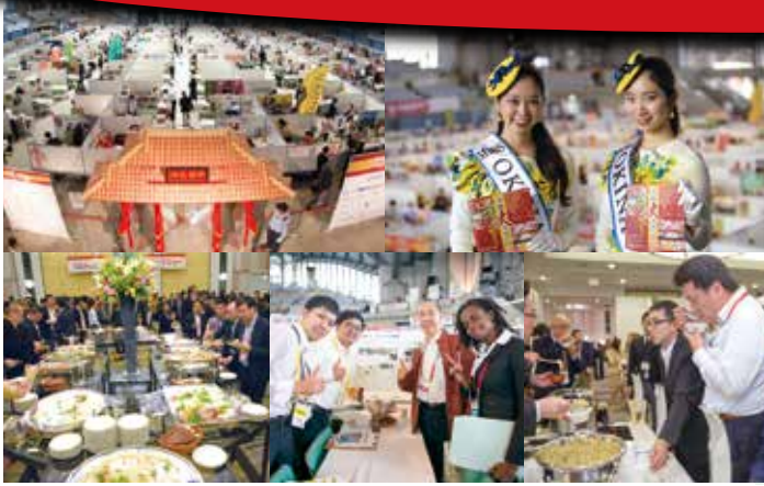
※右上の写真はミス沖縄2017

沖 縄大交易会とは、東アジアの中心に位置する沖縄の地位的優位性と沖縄国際物流ハブのネットワークを活用し日本各地の特産品等の販路拡大を目的に開催される「国際食品商談会」です。