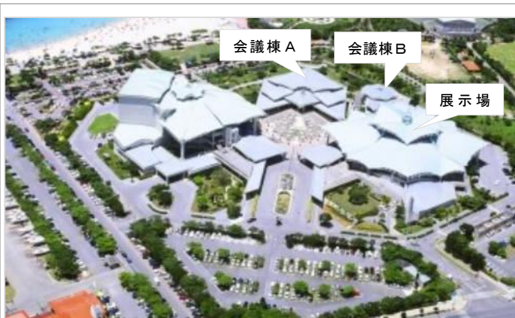
沖縄コンベンションセンター